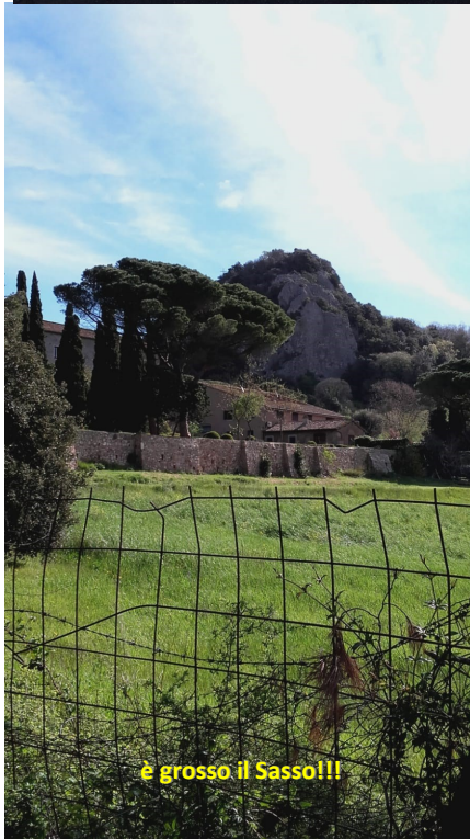
e grosso il Sasso!!!