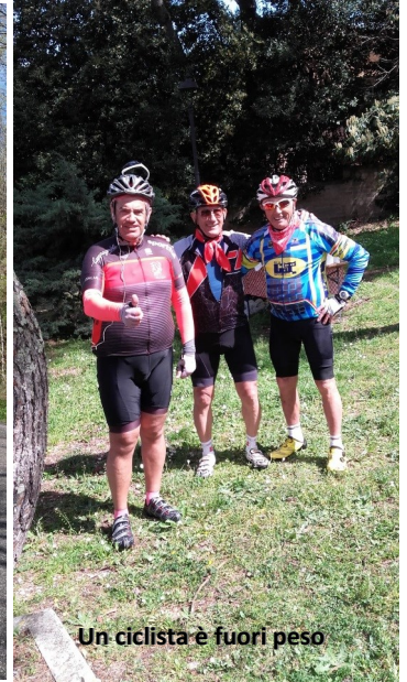
Un ciclista è fuori peso