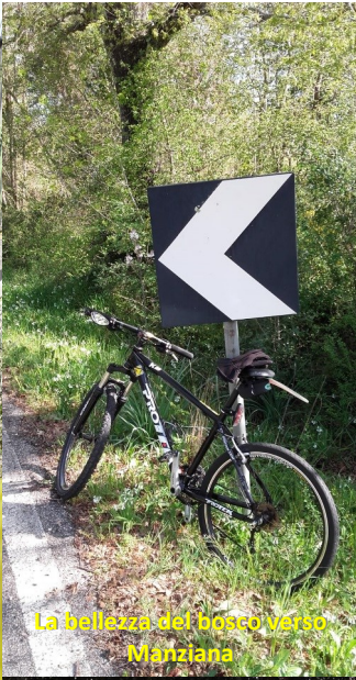
La bellezza del bosco verso Manziana