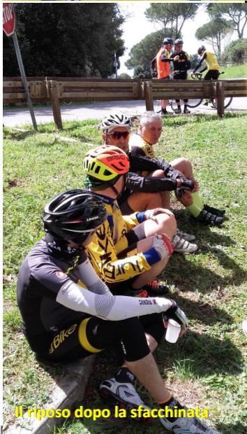
Il riposo dopo la sfacchinata