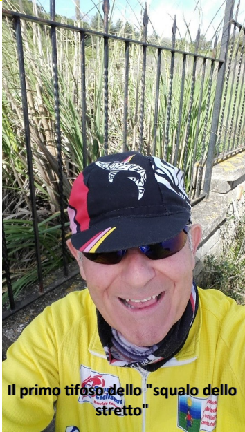
Il primo tifoso dello "squalo dello stretto"