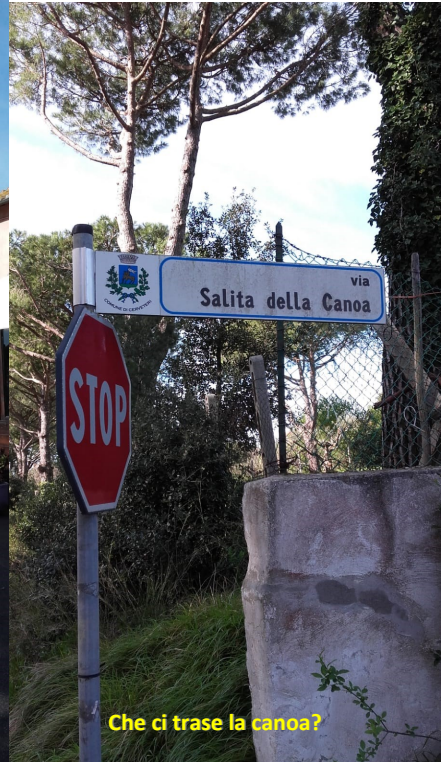
Che ci trase la canoa?