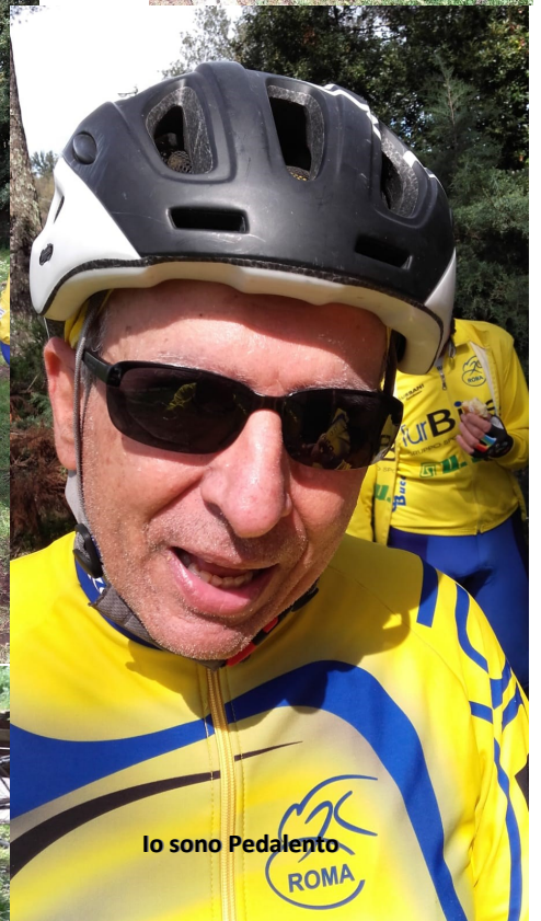
Io sono Pedalento