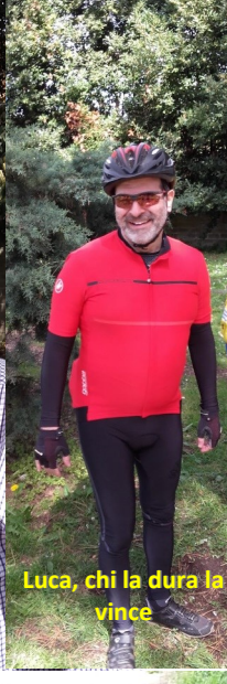
Luca, chi la dura la vince