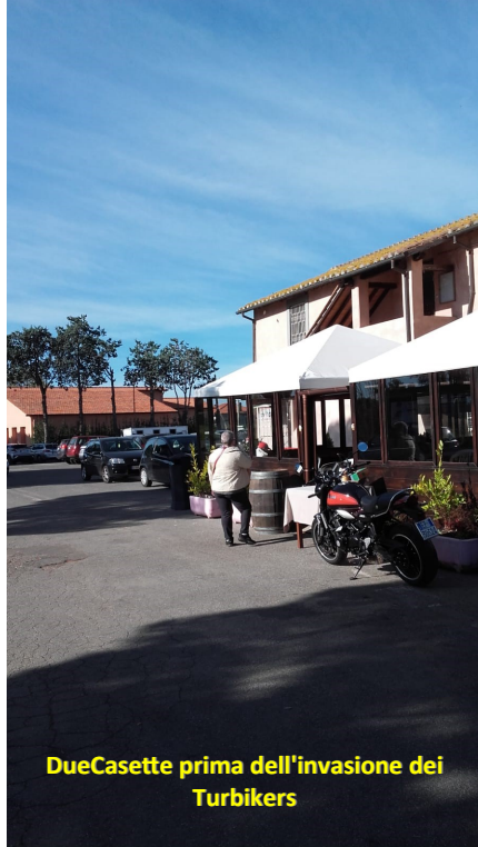
DueCasette prima dell'invasione dei Turbikers