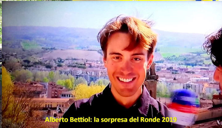
Alberto Bettiol: la sorpresa del Ronde 2019