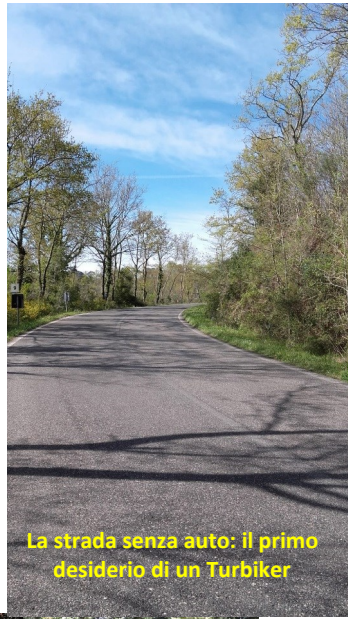
La strada senza auto: il primo desiderio di un Turbiker